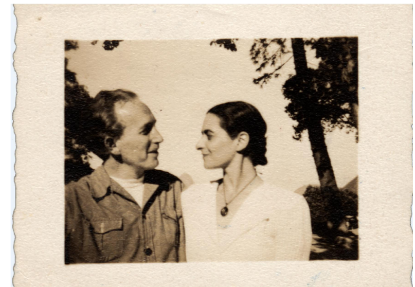
Maria Helena Vieira da Silva (Lisboa, 1908 – Paris, 1992)

Maria Helena Vieira da Silva (1908-1992) nasceu em Lisboa, a 13 de junho de 1908, no seio de uma família da classe alta com uma notória vida cultural.