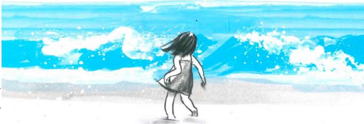
Ilustração: Susy Lee

Número máximo: seis bebés e mínimo: três bebés