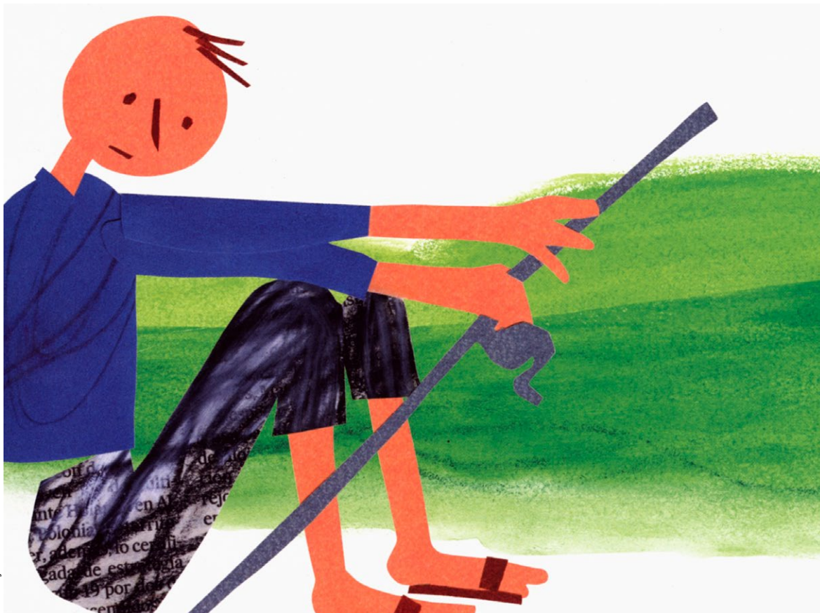
Ilustração: Manuel Estrada