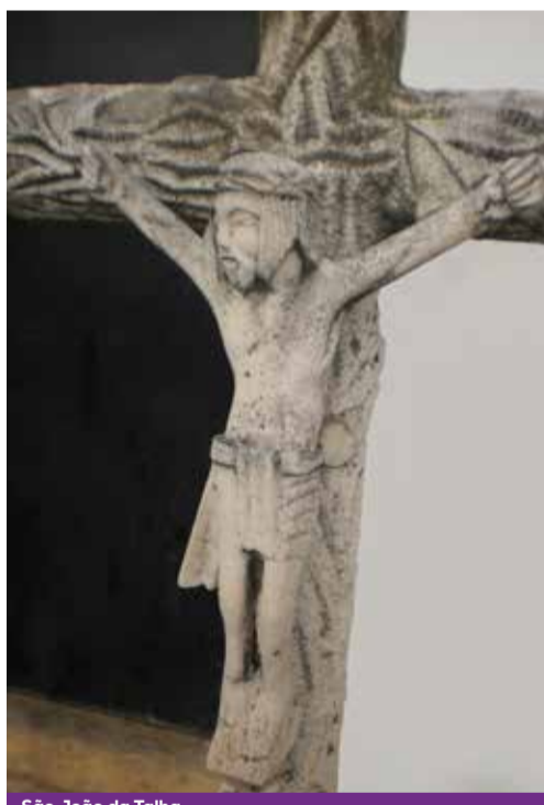
São João da Talha