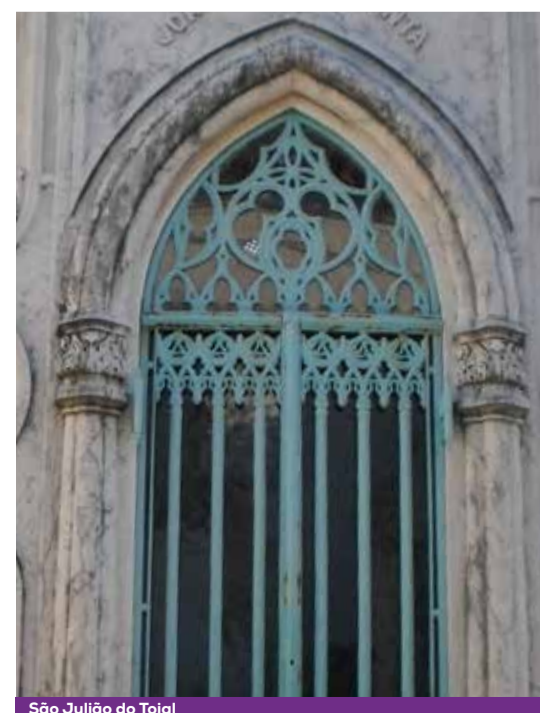
São Julião do Tojal