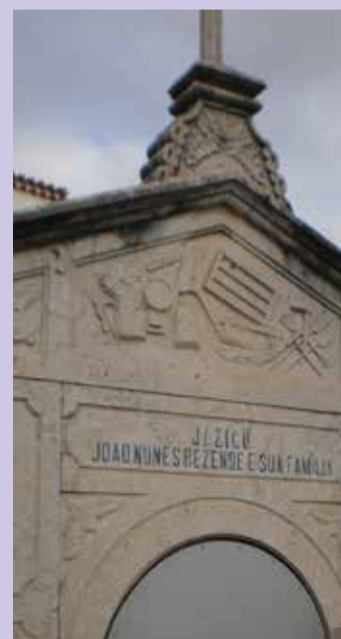
São João da Talha