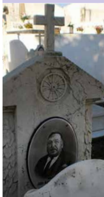
São Julião do Tojal

Os primeiros itinerários tocarão o retrato, o ferro, as cantarias e canteiros, o associativismo e as causas públicas. ♦