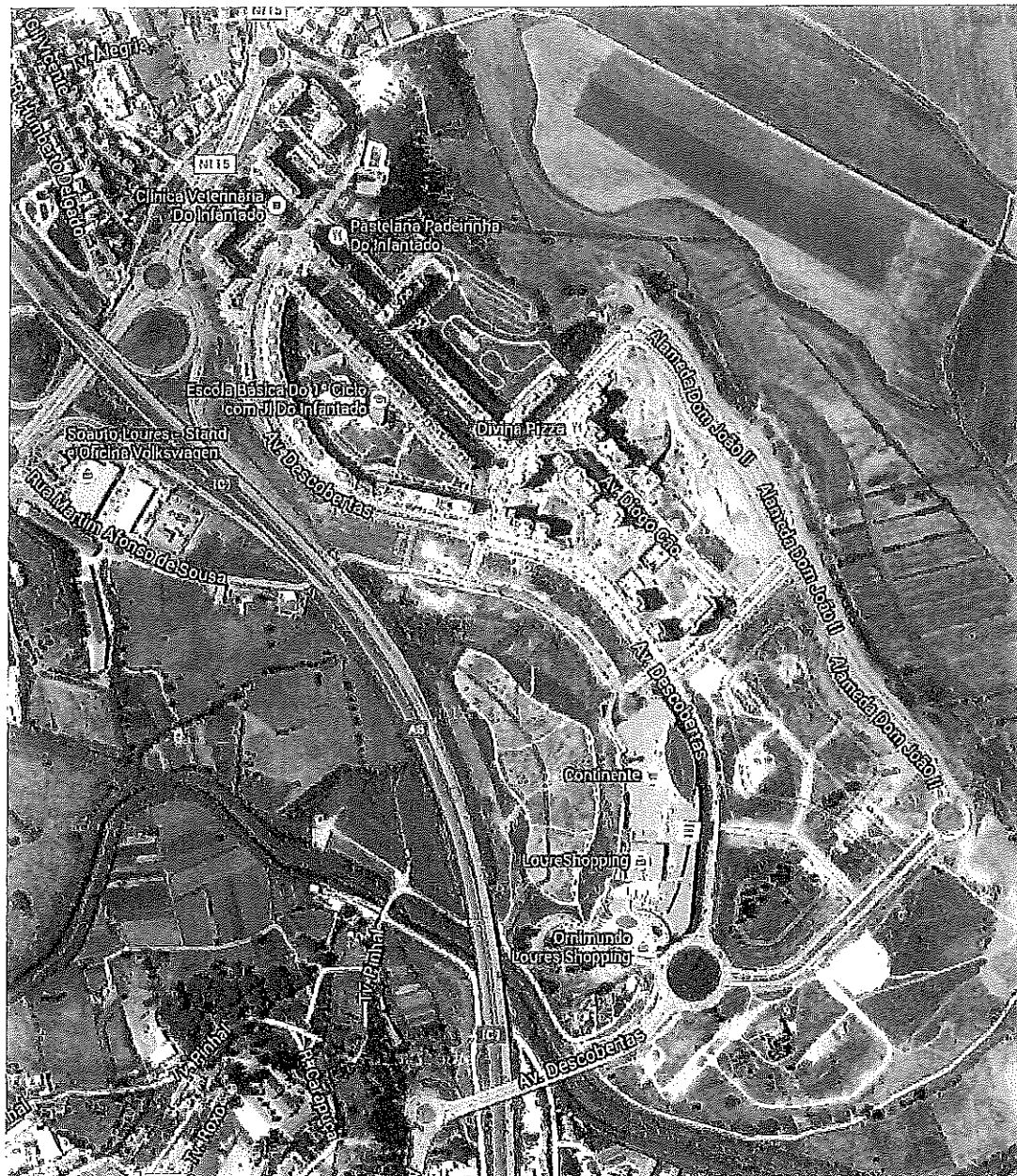
Partida e chegada na rua Vasco da Gama, percurso de ida e volta.

PERCURSO PROVA 1000 metros (Benjamins e Infantis)