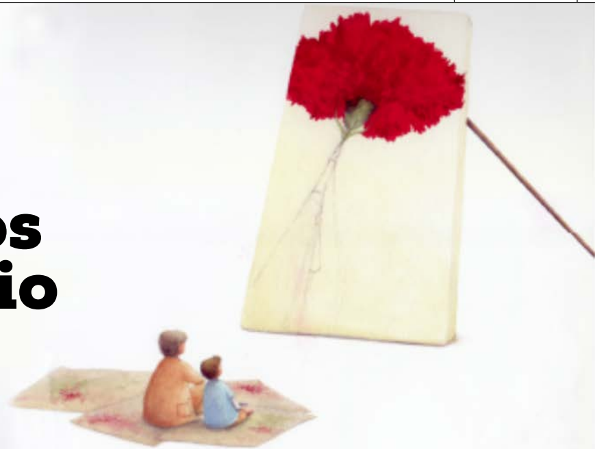
ILUSTRAÇÃO Abigail Ascenso