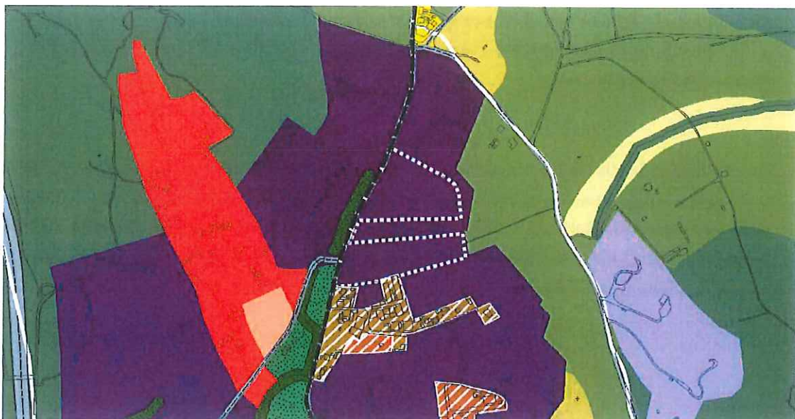
Limite da UE (tracejado branco) sobre planta de ordenamento, s/esc.

A UE a delimitar insere-se em solo urbanizável, espaços de atividades económicas de indústria e terciário, na Subunidade Operativa de Planeamento e Gestão (SUOPG) 05 – Tocadelos, a qual estabelece que a sua execução se deverá fazer através de unidades de execução. Confronta a norte e a sul com áreas já urbanizadas e edificadas, a nascente com solo rural e a poente com a EN 374.