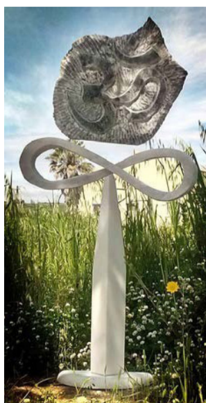
Caminhando no Universo