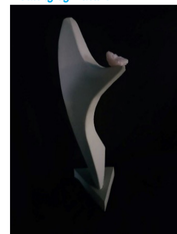
Healthy by Nature