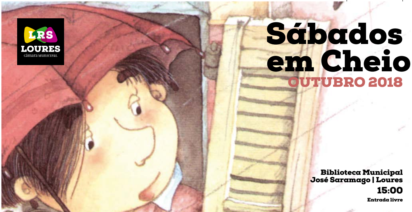
ILUSTRAÇÃO Eve Tharlet

Biblioteca Municipal José Saramago | Loures 15:00 Entrada livre