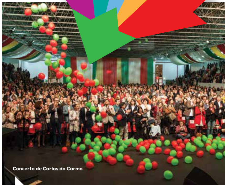
Concerto de Carlos do Carmo