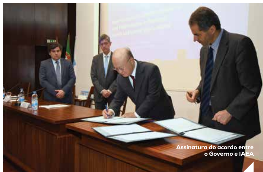
Assinatura do acordo entre o Governo e IAEA