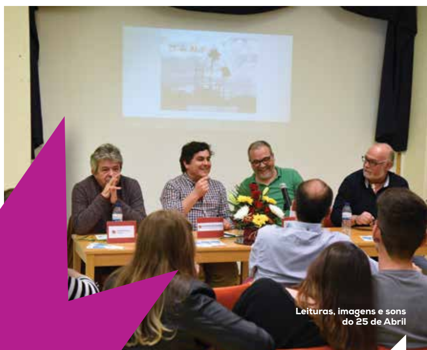
Leituras, imagens e sons do 25 de Abril