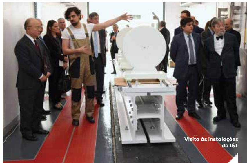
Visita às instalações do IST