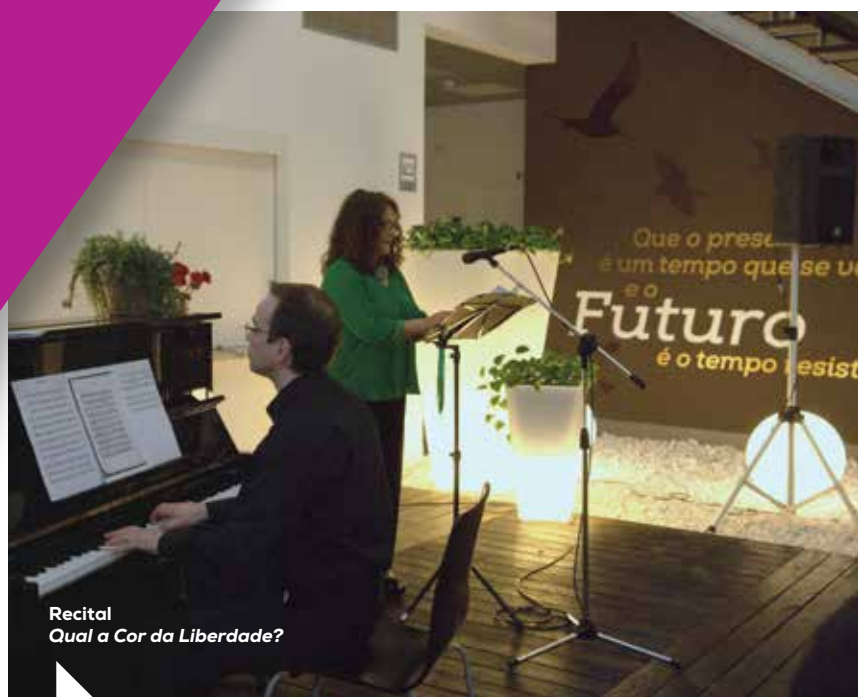
Recital Qual a Cor da Liberdade?