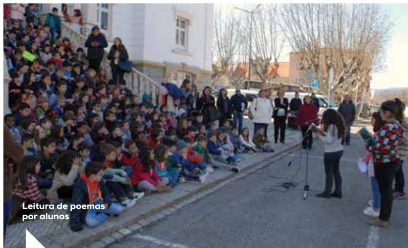
Leitura de poemas por alunos

As crianças aproveitaram, ainda, para fazer uma breve visita à exposição patente nos Paços do Concelho. Dotada de uma grande originalidade, a exposição era composta por dezenas de poemas escritos pelos alunos dos diversos agrupamentos e instituições do concelho, que se encontravam expostos numa espécie de “estendal da poesia”.