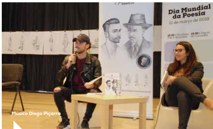
Músico Diogo Piçarra