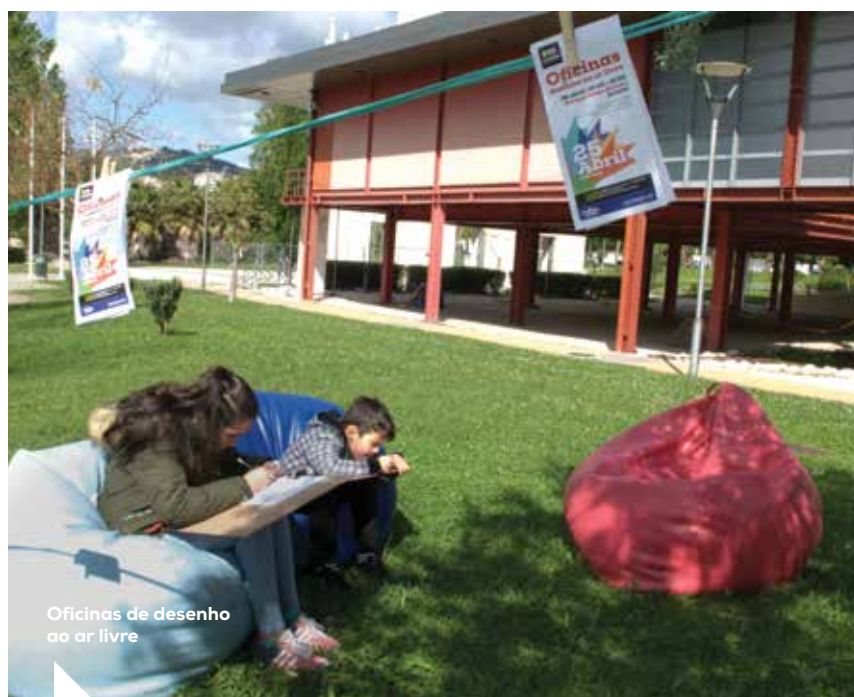
Oficinas de desenho ao ar livre