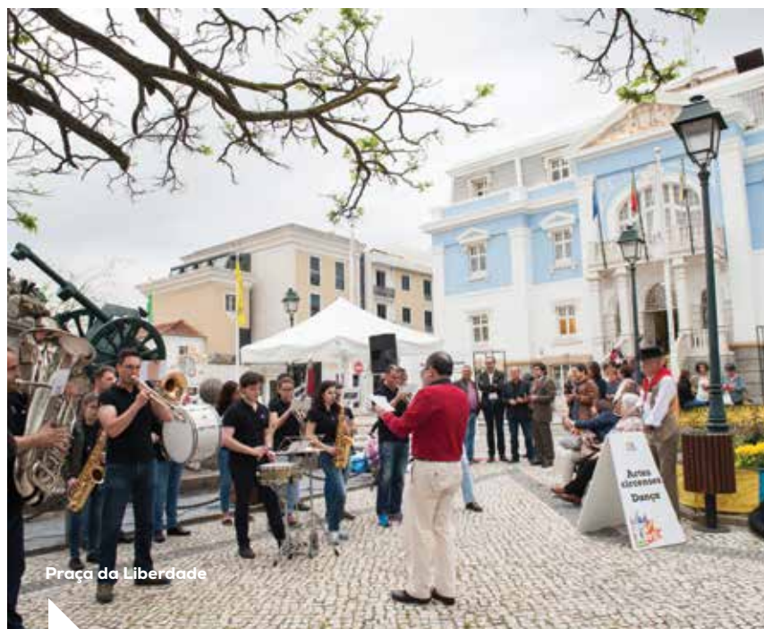
Praça da Liberdade