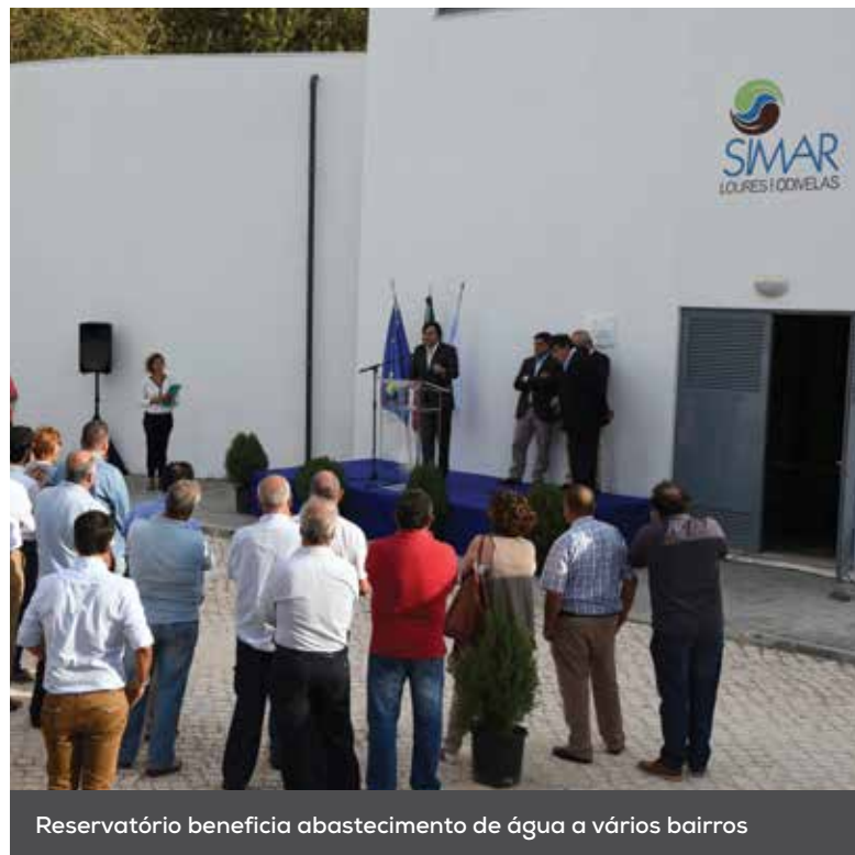
Reservatório beneficia abastecimento de água a vários bairros

SIMAR inauguraram o reservatório de água de Santa Maria, situado no Casal do Covão, em Loures.