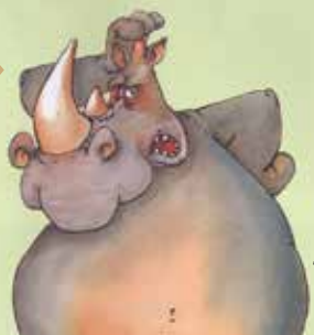
ILUSTRAÇÃO: Frédéric Tessier

Um êxito no país vizinho, que gostaríamos de reviver aqui. Uma animação para quem gosta de sopa de legumes, ou para quem quiser esforçar-se por vir a gostar. Pela vossa saúde, riam e comam sopa.