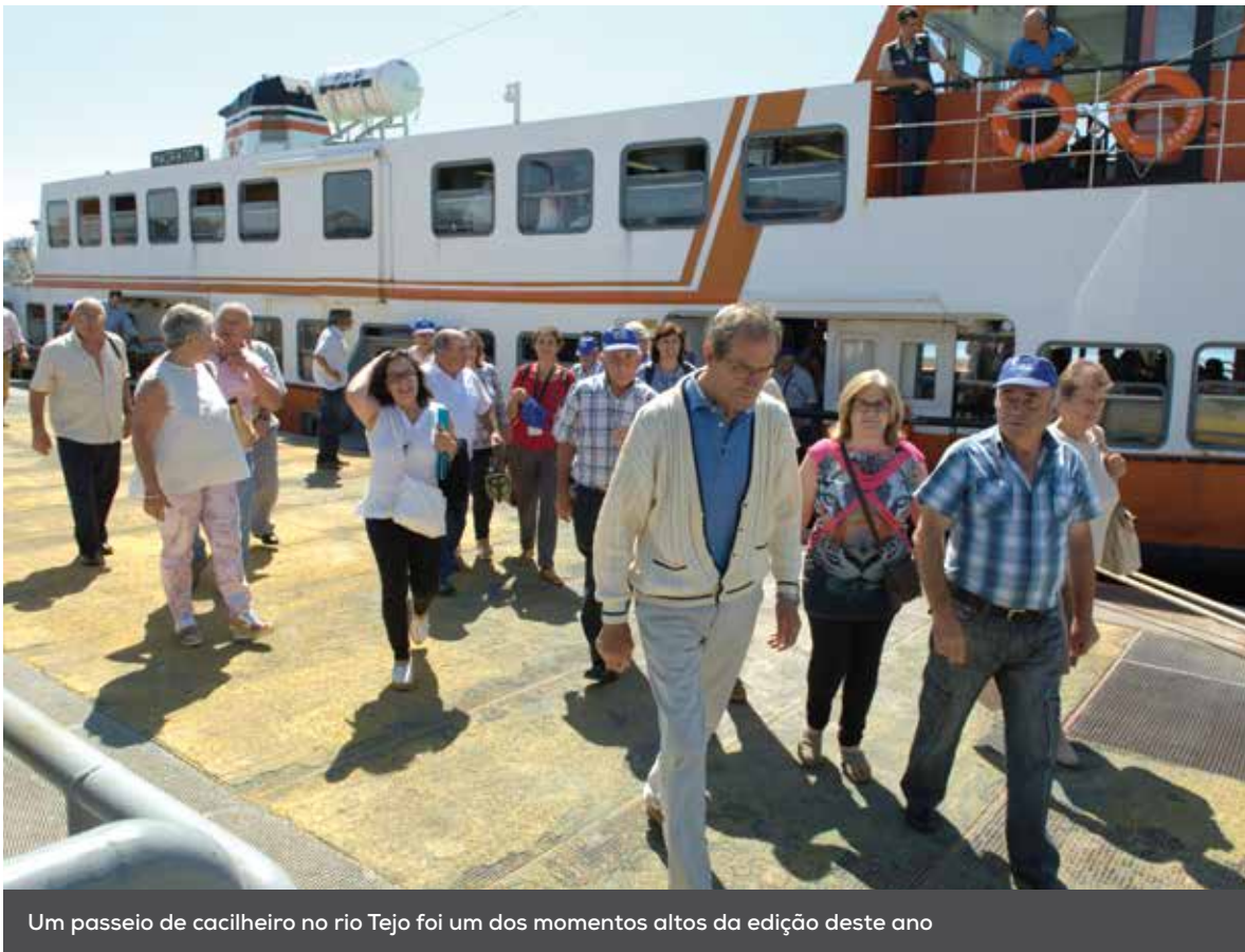
Um passeio de cacilheiro no rio Tejo foi um dos momentos altos da edição deste ano

Durante o mês de setembro, cerca de sete mil pessoas participaram na 37ª edição do Passeio Sénior , desfrutando de um dia diferente de passeio e convívio.