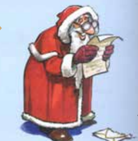
ILUSTRAÇÃO: Frédéric Tessier

Contam-se histórias com sabores natalícios. Contos polvilhados de canela, próprios de noite de consoada.