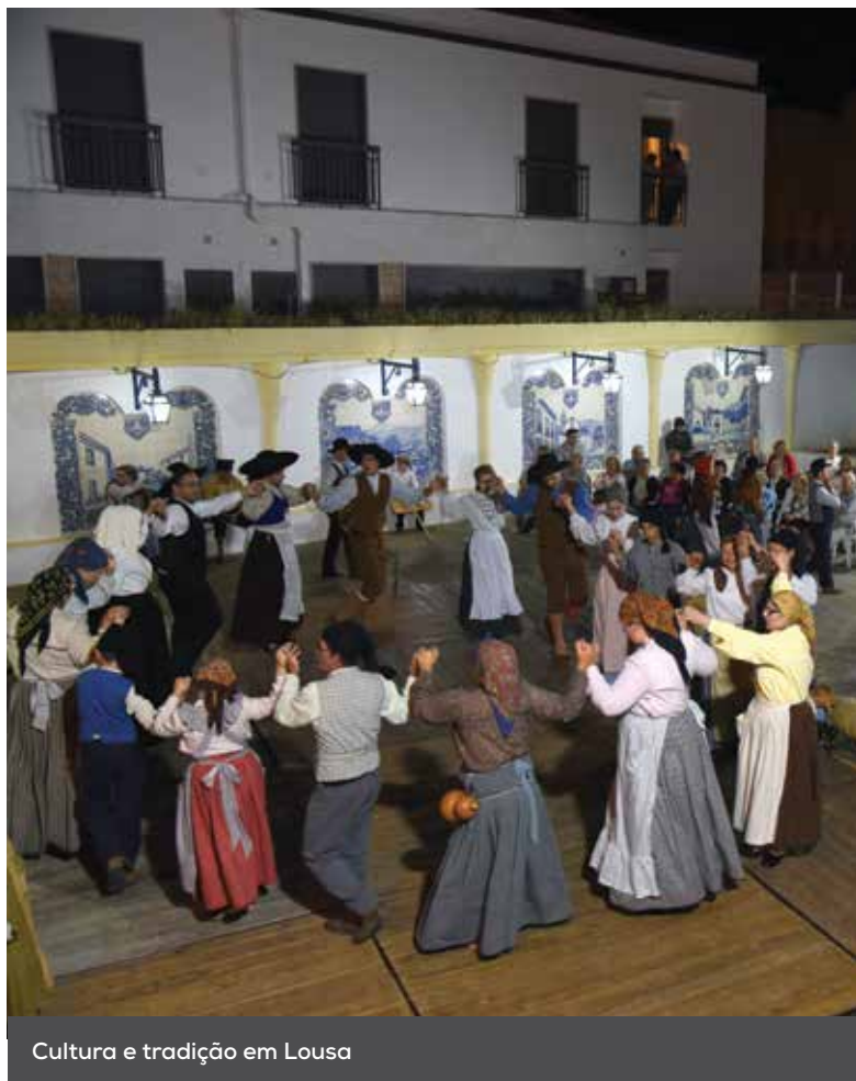
Cultura e tradição em Louisa