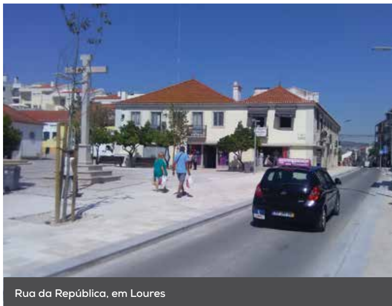
Rua da República, em Loures

Está concluída a primeira fase das obras de revitalização dos centros urbanos da cidade de Loures e das vilas de Camarate e Moscavide. Espaços renovados e com mais vida estão agora à disposição dos munícipes.