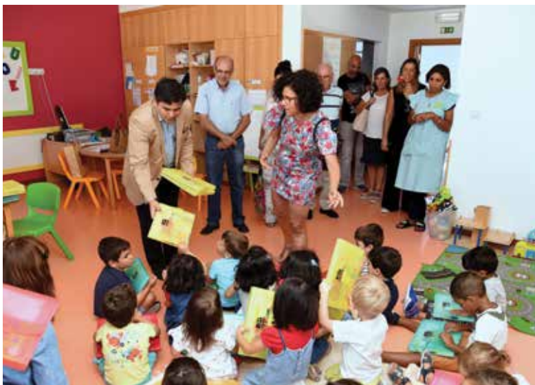
Entrega de kits escolares

A Câmara Municipal de Loures assinalou o início do ano letivo 2017/2018 com um conjunto de atividades dirigidas a toda a comunidade educativa.