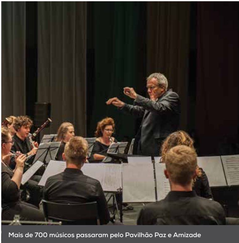
Mais de 700 músicos passaram pelo Pavilhão Paz e Amizade

Milhares de pessoas passaram pelo Pavilhão Paz e Amizade, em Loures, para assistirem aos concertos do Festival Internacional de Bandas Filarmónicas, que decorreram nos dias 17, 18 e 19 de novembro.