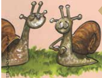
ILUSTRAÇÃO: Sónia França Ruyter

Animação a partir de textos de Beatriz Osés, a mesma autora dos fantásticos Contos-Pulga .