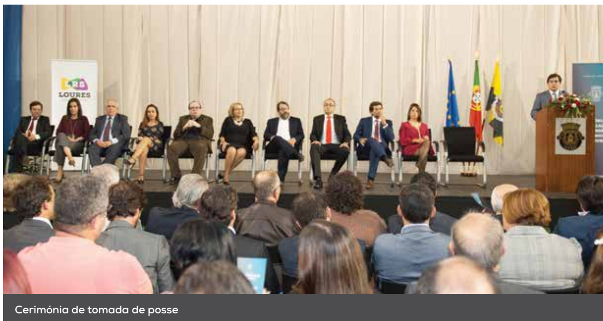
Cerimónia de tomada de posse

A cerimónia pública de instalação dos novos órgãos autárquicos do Município de Loures decorreu, no dia 20 de outubro, no Pavilhão Paz e Amizade.