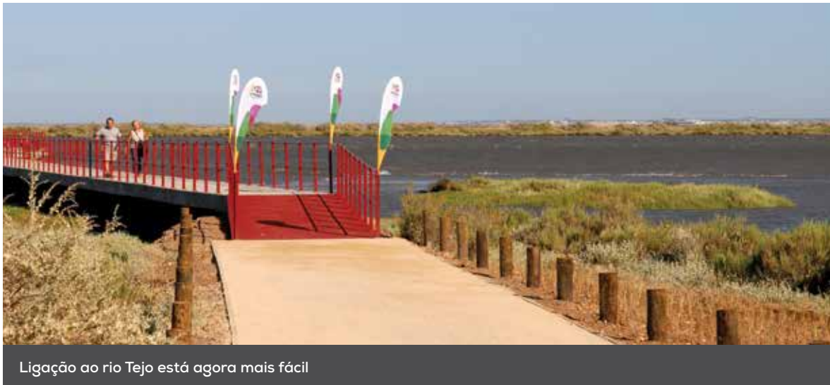
Ligação ao rio Tejo está agora mais fácil

Está aberta ao público a primeira fase do projeto da Frente Ribeirinha do Tejo. Um percurso pedonal e ciclável de 740 metros, que liga a estação de Santa Iria de Azóia e o pontão da BP, permitindo uma maior aproximação dos cidadãos ao rio.