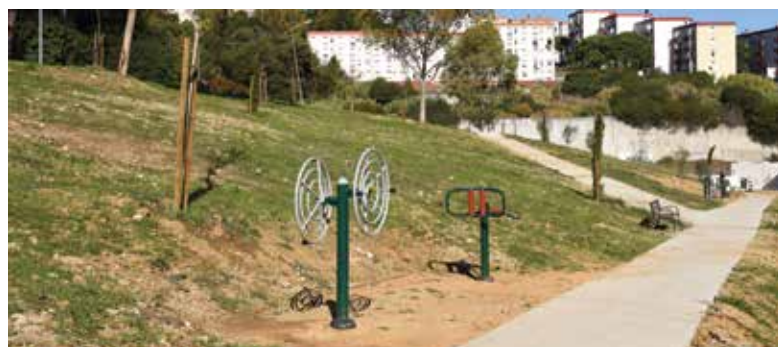
Novas zonas de lazer para a população