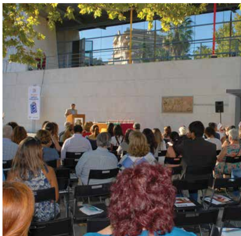
Cerimónia de homenagem aos agentes educativos

Destaque, ainda, para a edição do Guia de Respostas Educativas para o ano letivo de 2017/2018, que sistematiza a oferta do Município de Loures e traduz a aposta municipal na valorização da escola pública.