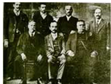
4 de outubro de 1910 Implantação da República em Loures