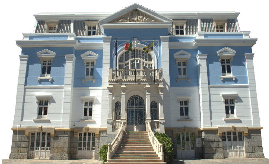
CÂMARA MUNICIPAL DE LOURES