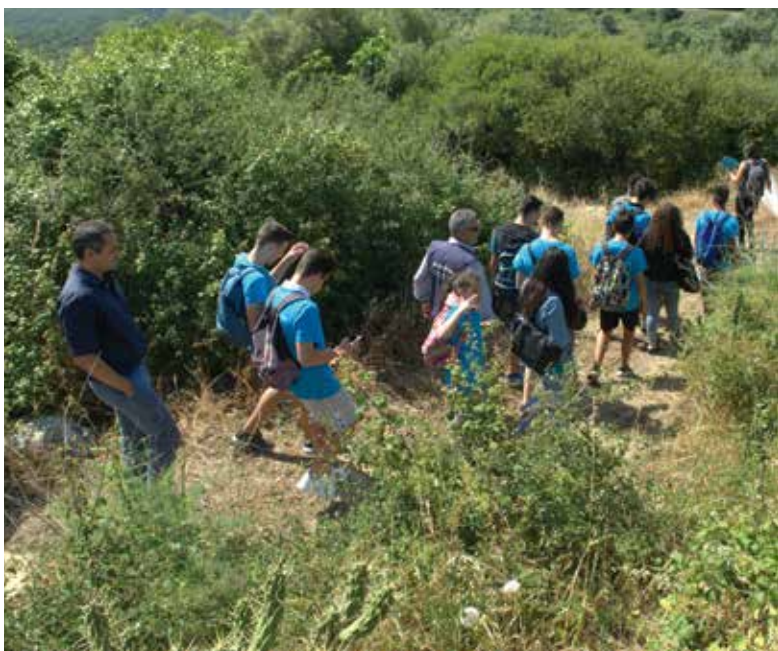
Percurso pedestre tem cerca de um quilómetro

Foi inaugurada, no dia 22 de maio, a Estação da Biodiversidade de Fontelas, a primeira na Área Metropolitana de Lisboa.