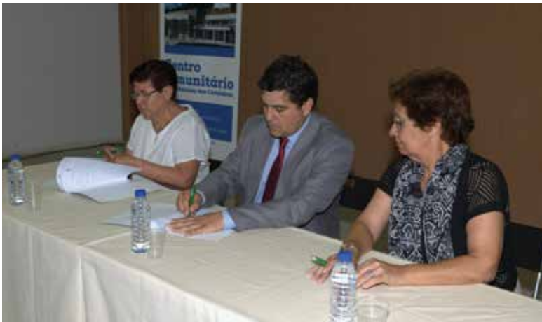
Assinatura de contrato de utilização com a AMSAC

A cerimónia dos 47 anos da Associação de Moradores de Santo António dos Cavaleiros (AMSAC) ficou marcada pela assinatura do contrato de utilização do novo Centro Comunitário, que ficará concluído no mês de julho.