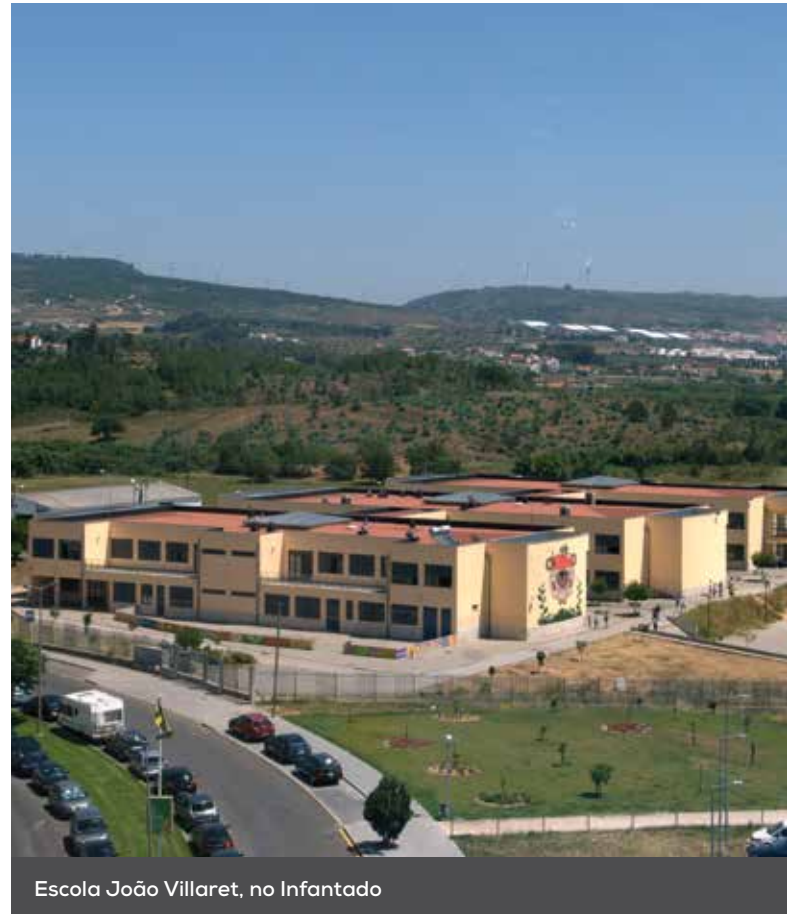
Escola João Villaret, no Infantado