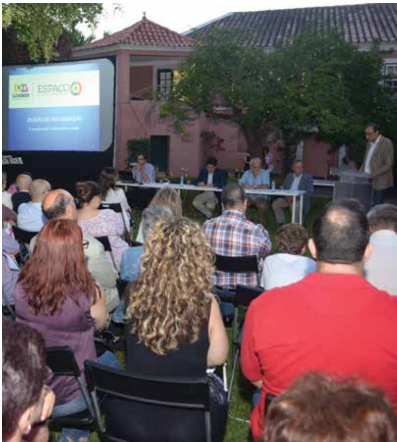
Apresentação do novo serviço municipal

Foi inaugurado, no dia 21 de junho, o Espaço A , um novo serviço municipal que dará apoio técnico ao movimento associativo popular.