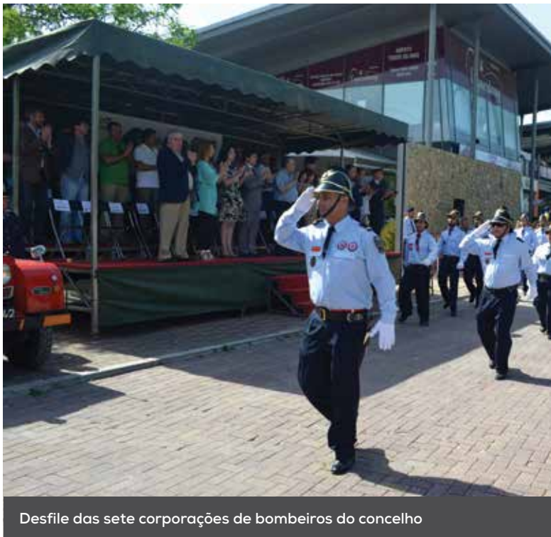
Desfile das sete corporações de bombeiros do concelho

A Câmara de Loures assinalou, a 20 e 21 de maio, o Dia Municipal do Bombeiro, com um conjunto de iniciativas que visaram reconhecer publicamente o trabalho dos homens e das mulheres que integram as sete corporações de bombeiros do concelho.