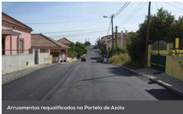
Arruamentos requalificados na Portela de Azóia

to municipal superior a 162 mil euros. Já em Santo António dos Cavaleiros, o investimento municipal ascendeu os 149 mil euros e destinou-se à repavimentação do viaduto do Almirante e da rotunda de acesso à Quinta do Almirante, bem como à substituição das juntas de dilatação do viaduto e à manutenção dos passeios da área envolvente. No que diz respeito à beneficiação da rede de iluminação pública, as últimas intervenções tiveram lugar no Largo de São Roque, em Vila de Rei, Bucelas, na Travessa do Alto do Piçarreiro, no Zambujal, e ainda na Praceta das Torres e área envolvente, no Bairro Operário, em São João da Talha. No Bairro da Torre, em Camarate, a intervenção englobou a reposição do funcionamento da rede de iluminação pública, bem como a substituição de 27 focos obsoletos.