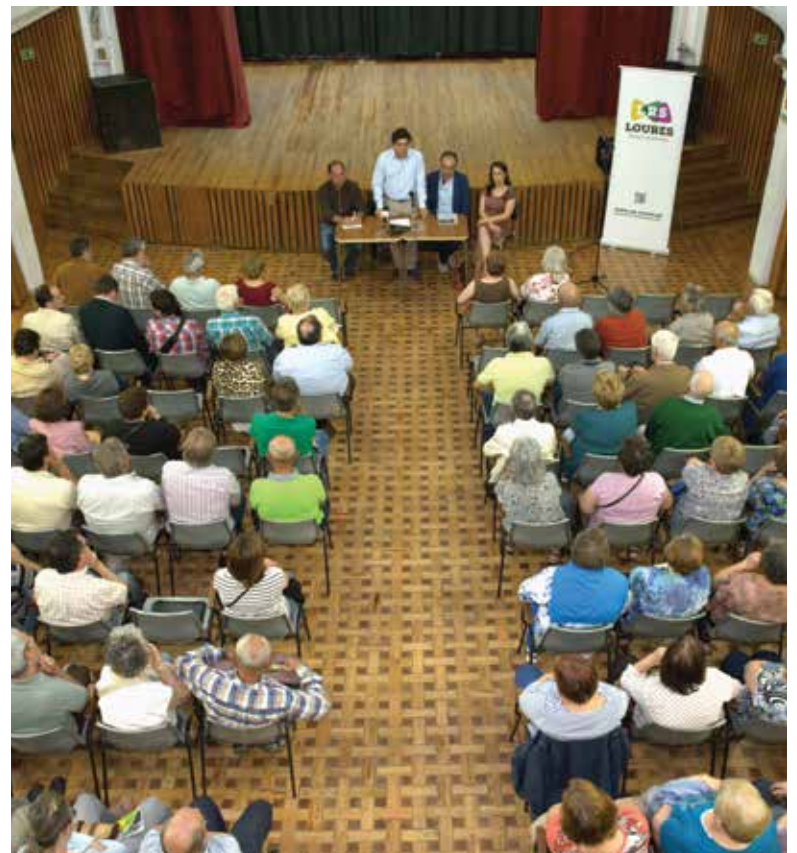
Sessão pública de esclarecimento

Recorde-se que o Município já tinha disponibilizado um terreno no Bairro Terra de Frades e encetado diversos contactos com o Governo e a ARSLVT, nomeadamente, com o Governo anterior. O contrato-programa consiste no financiamento completo do edifício pelo Ministério da Saúde, num valor superior a 1 milhão de euros, ficando a Câmara com a responsabilidade de mandar fazer o projeto, lançar a empreitada e fiscalizar a obra, para além de executar os arranjos exteriores do Centro de Saúde.