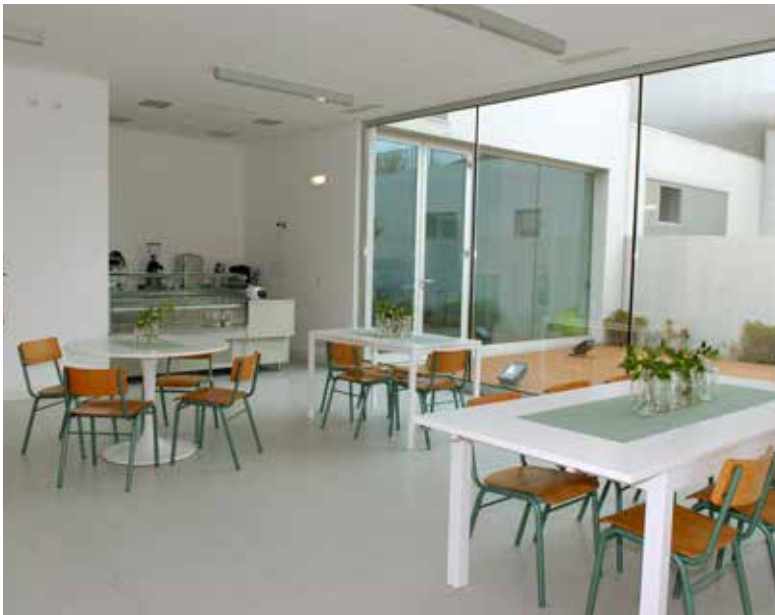
Centro tem capacidade para 30 utentes

Foi inaugurado, a 21 de junho, o Centro de Atividades Ocupacionais (CAO) para jovens adultos com deficiência, em Moscavide.