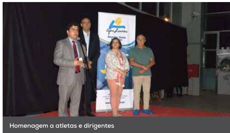
Homenagem a atletas e dirigentes

Ainda no âmbito das comemorações dos seus 25 anos, a GesLoures organizou muitas outras atividades, em que se contam festivais de natação e a partici-