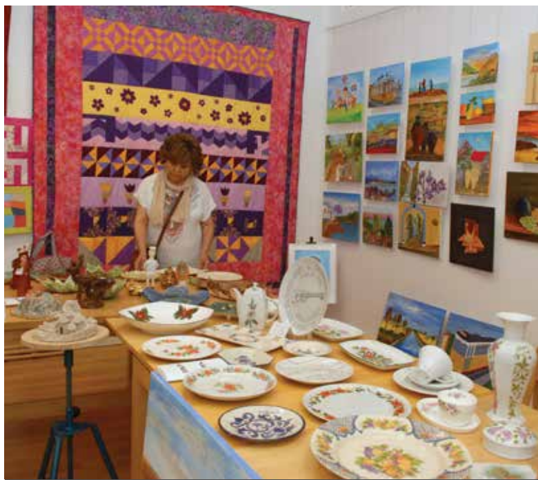
Trabalhos da disciplina de Artes e Ofícios