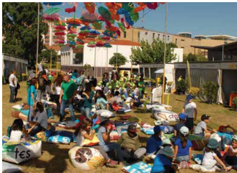
Segunda edição decorreu no Parque Adão Barata

A Estação da Biodiversidade de Fontelas, a trigésima inaugurada no país, e a primeira na Área Metropolitana de Lisboa, foi financiada pela Câmara Municipal de Loures, tendo o projeto sido desenvolvido pela equipa técnica da Divisão de Zonas Verdes e Floresta com o apoio, no terreno, da Equipa de Sapadores Florestais.