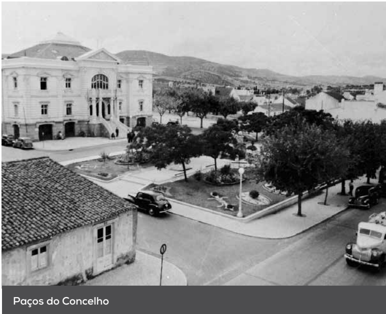
Paços do Concelho

Para muitos e muitas que nasceram perto ou depois da data histórica de 25 de Abril de 1974; para muitos e muitas que fizeram incursões na política mais partidarizada ou independente, e deram muito da sua vida pessoal e profissional para cumprir a esperança de uma vida com Liberdade, comemorar a data das primeiras eleições democráticas para as autarquias – assembleia de freguesia, câmara e assembleia municipal – 12 de dezembro de 1976 é uma data de relevância.