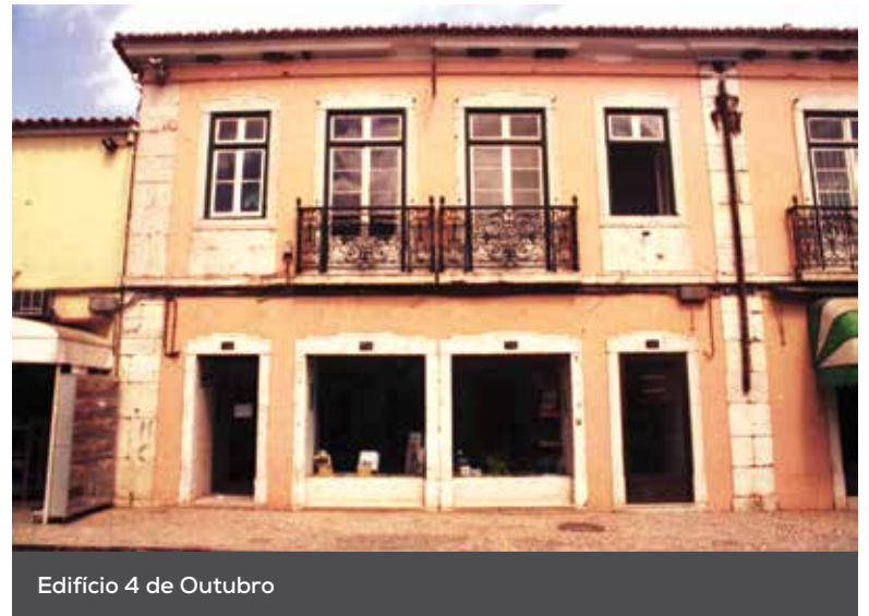
Edifício 4 de Outubro

– Oh! Loures, a partir de 12 de dezembro, aqui vamos nós!