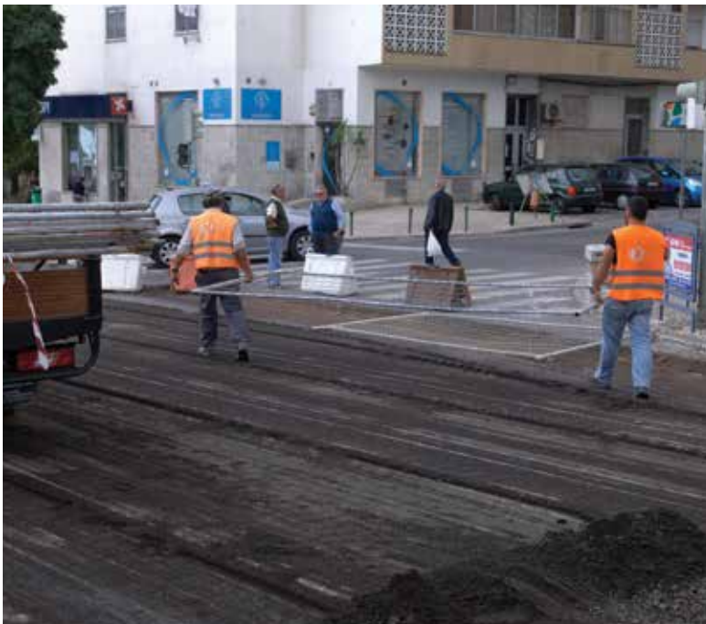
Rua da República (Loures)