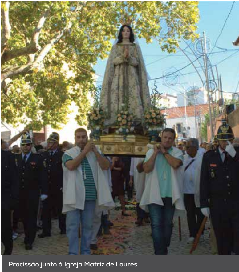
Procissão junto à Igreja Matriz de Loures

A última vez que Loures tinha recebido a imagem de Nossa Senhora do Cabo, conhecida como Círio Saloio, foi há 26 anos. A efeméride voltou a acontecer a 1 de outubro, dia em que a paróquia de Loures se tornou palco de uma das festas católicas mais antigas de Portugal.