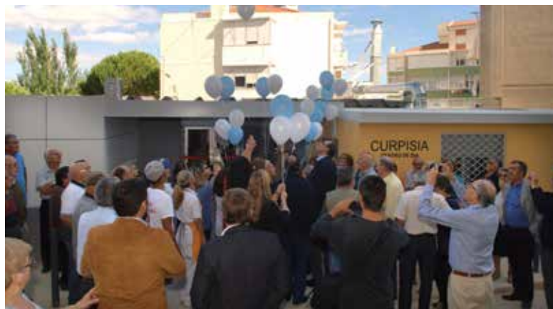
Novas instalações inauguradas

A Comissão Unitária de Reformados, Pensionistas e Idosos de Santa Iria de Azóia (CURPISIA) inaugurou, no dia 11 de outubro, as novas instalações do Centro de Dia. As obras contemplaram a ampliação da cozinha – apetrechada com novo equipamento e com capacidade para servir cerca de uma centena e meia de refeições diárias –, novos balneários para os funcionários, sala de refeições com mobiliário novo, criação de uma sala multiusos e de uma lavandaria anexa ao edifício principal, em instalações cedidas pela União de Freguesias de Santa Iria de Azóia, São João da Talha e Bobadela. Da parte do Município, foram igualmente prestados apoios, nomeadamente, ao nível do projeto de arquitetura, águas e esgotos, pinturas e construção do passeio envolvente ao equipamento social.