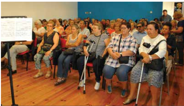
Seniores já iniciaram as aulas

Os polos de Loures e Sacavém da Academia de Saberes – Universidade Sénior, deram as boas-vindas aos professores e alunos para o ano letivo 2016/2017, cujas aulas se iniciaram a 10 de outubro.