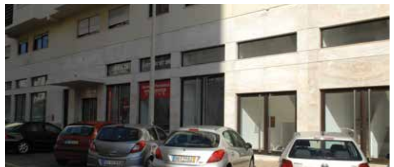
Novas instalações na Quinta do Património

Ainda não existe uma previsão para a reabertura deste serviço, mas espera-se que o novo espaço abra até ao final do ano, após a conclusão das obras a cargo do Instituto de Segurança Social.