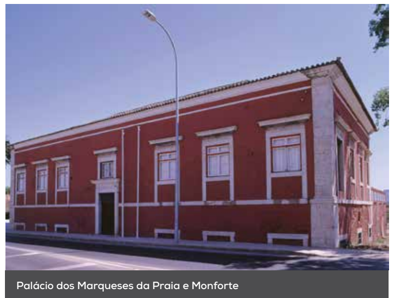
Palácio dos Marqueses da Praia e Monforte