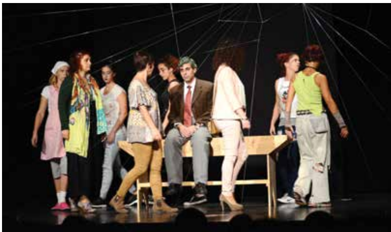
Cineteatro de Loures recebeu várias peças

Pathelin; O senhor desejo mesmo; Comédias da vida privada e outras histórias; Árvores, verdes árvores; Vem aí o Zé das Moscas; A história da sopa da pedra; E aqui morreu Beckett; A esperteza do criado Zanni; Com paixão; Ensaíos. Esta mostra contou com a participação da Companhia ARTELIER?, Teatro AGITA, Teatro a Descoberto – Sociedade Recreativa e Musical 1.º de Agosto Santa Iriense, Teatr'Up e Teatr'Up Kids – Sociedade Filarmónica União Pinheirense, Grupo Dramático e Recreativo Corações de Vale Figueira, Cénico da AHBV de Fanhões, GATAM – Grupo Amador de Teatro "Os Amigos da Manjoeira", Casa do Gaiato/Alquimia do Sonho, TIL – Teatro Independente de Loures, Associação Teatro IBISCO e Grupo de Teatro João Villaret, da Escola Básica João Villaret.