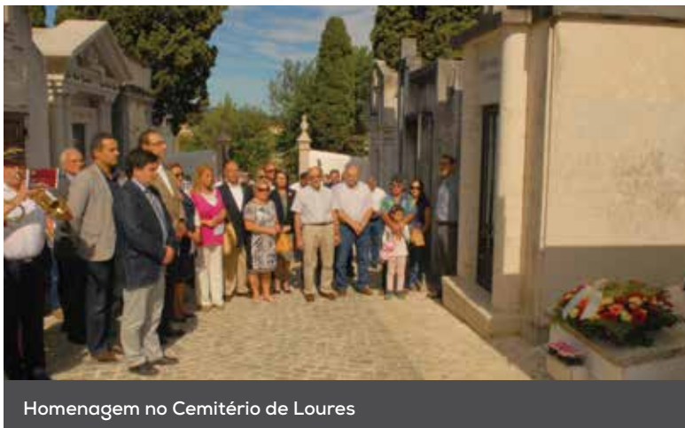
Homenagem no Cemitério de Loures

A cerimónia prosseguiu com uma romagem ao Cemitério Municipal de Loures, onde foram depositadas flores no mausoléu dos membros da Junta Revolucionária. O momento foi assinalado com um toque de homenagem, por parte do Quarteto de Metais da Banda da Associação Humanitária dos Bombeiros Voluntários de Loures, e pelo lançamento de foguetes que recriaram o momento da Implantação da República, há 106 anos.