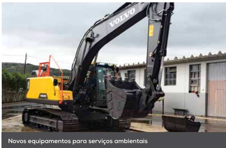
Novos equipamentos para serviços ambientais

No passado dia 4 de novembro, teve lugar, nas Oficinas Municipais, a entrega de novas viaturas e equipamentos, destinados a reforçar a eficácia e a qualidade do trabalho desenvolvido pelo Município nas áreas da manutenção florestal, ambiental e da limpeza urbana.