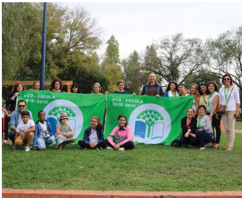
Bandeiras verdes entregues a escolas de Loures

As escolas Maria Veleada, General Humberto Delgado, Mário de Sá Carneiro, João Villaret, Escola Secundária José Cardoso Pires, Escola Básica do Prior Velho, Nuclisol Jean Piaget, Associação O Saltarico e o Colégio Integrado Monte Maior, foram as escolas do concelho de Loures galardoadas com a Bandeira Verde Eco Escolas .