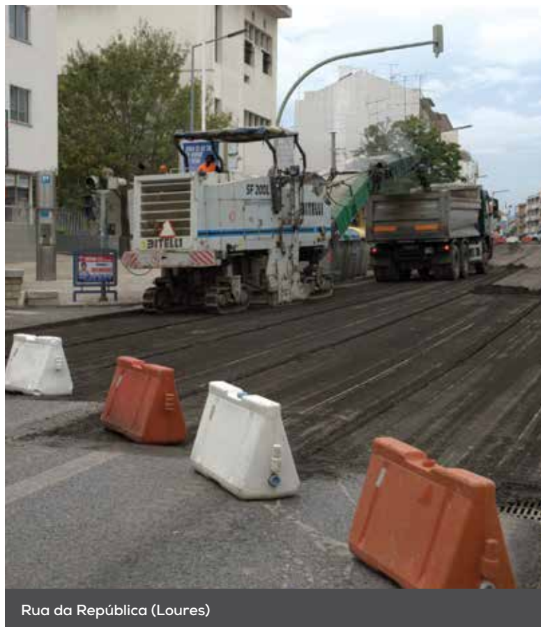
Rua da República (Loures)

▶ Substituir os contentores existentes na Rua da República, por um sistema subterrâneo.