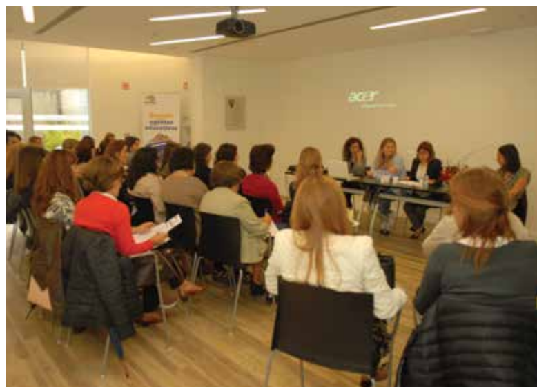
Debate na Biblioteca Ary dos Santos

A Biblioteca Municipal Ary dos Santos recebeu o debate de encerramento da receção aos agentes educativos do concelho de Loures referente ao ano letivo de 2016/2017.