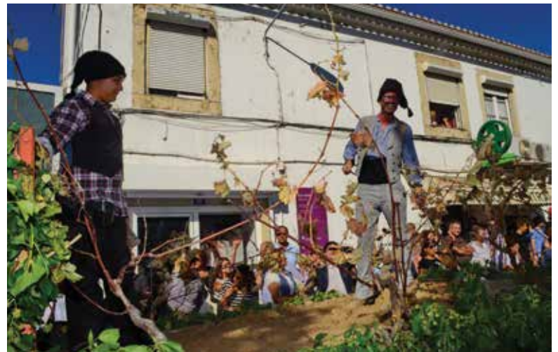
Tradição de volta a Bucelas

Desfile etnográfico, provas de vinho, exposições, concertos, mostra vitivinícola e de produtos regionais, passeios e visitas marcaram a edição deste ano, que decorreu na Capital do Arinto* entre os dias 7 e 9 de outubro.