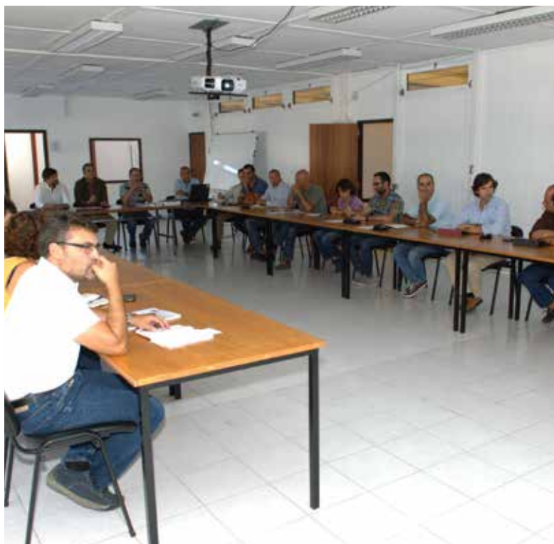
Comissão Municipal de Proteção Civil

ta Luís de Camões e na Quinta das Manteigas), Estrada Militar no Campo do Rio, em Camarate, passagem inferior no Bairro da Fraternidade (no troço de escoamento confinante com a A1), bacia de laminagem no nó de Frielas (com reformulação do projeto e intervenção em parceria com a IKEA), rio de Loures (sobre a EN 115 até à Escola da Polícia Judiciária, no Barro) e ribeira da Póvoa (entre a antiga UNOR e a Ponte de Frielas).