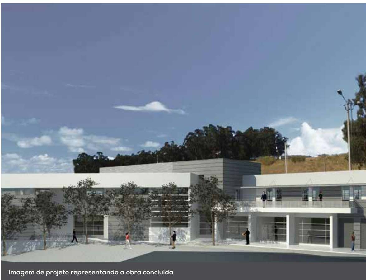
Imagem de projeto representando a obra concluída