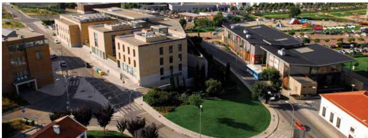
Acessibilidade e mobilidade são preocupações do Município

Definir um plano de intervenção no âmbito da acessibilidade e da mobilidade é a oportunidade para o Município dar início ao trabalho de requalificação da cidade de Loures – com vista à obtenção da certificação de Cidade Acessível para Todos .