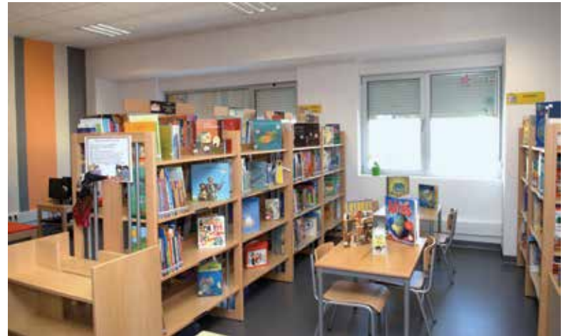
Loures rejeita mais competências para as autarquias