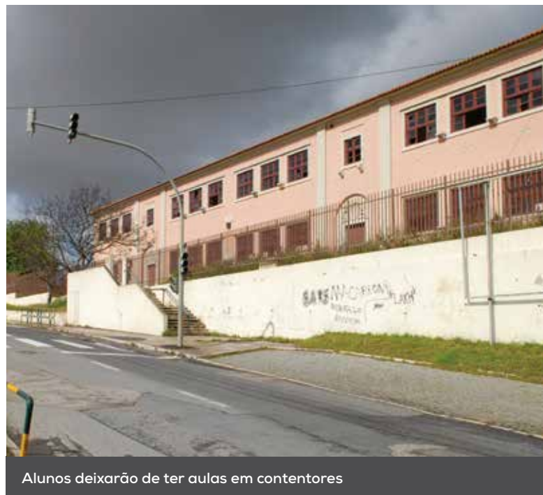
Alunos deixarão de ter aulas em contentores