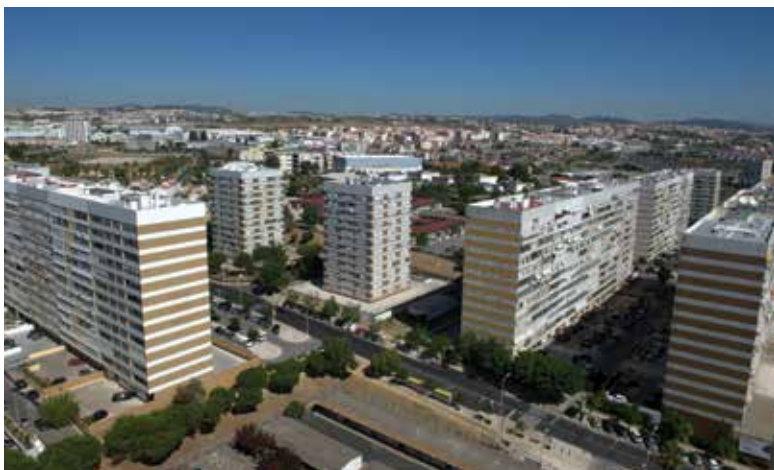
PDM abre perspectivas diferentes de gestão do território

A proposta, acompanhada pelo relatório de ponderação das reclamações, sugestões e pedidos de esclarecimento, encontra-se disponível para consulta no Sítio da Câmara Municipal e no Departamento de Planeamento e Gestão Urbanística, todos os dias úteis das 09h00 às 16h00.