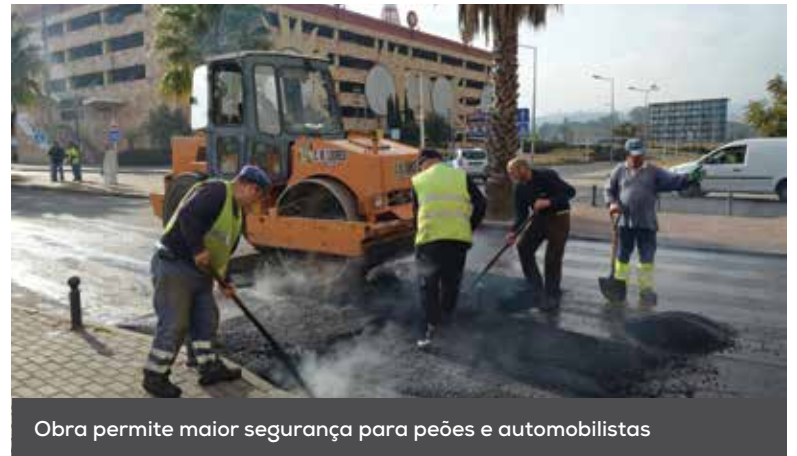
Obra permite maior segurança para peões e automobilistas

Estão em execução as obras de construção de passadeiras sobrelevadas, na Avenida das Descobertas, no Infantado. As obras, a cargo da Câmara Municipal de Loures, realizam-se em duas fases, estando concluída a primeira fase, que implicou o corte das faixas de rodagem, nos dois sentidos, junto ao LoureShopping. Com esta alteração, a Autarquia espera contribuir para melhorar a prevenção rodoviária, obrigando a uma redução da velocidade do tráfego automóvel, traduzindo-se numa maior segurança para peões e automobilistas e na garantia de acesso para pessoas com mobilidade reduzida.