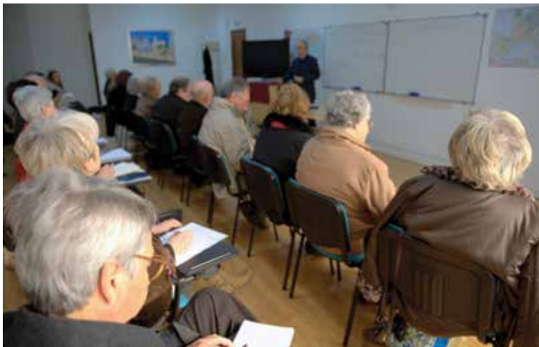
Aula de economia política

A Academia dos Saberes da Câmara Municipal de Loures, com polos em Loures e Sacavém, é um espaço de partilha de experiências, conhecimento e convívio para residentes no concelho com mais de 50 anos. Promover o envelhecimento ativo e saudável é o objetivo da universidade sénior do concelho de Loures.