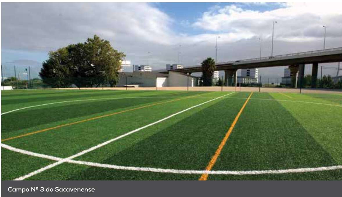
Campo Nº 3 do Sacavenense

O desporto é uma das áreas em destaque da Câmara de Loures, que tem apostado fortemente na criação de infraestruturas que sirvam as várias freguesias do concelho.