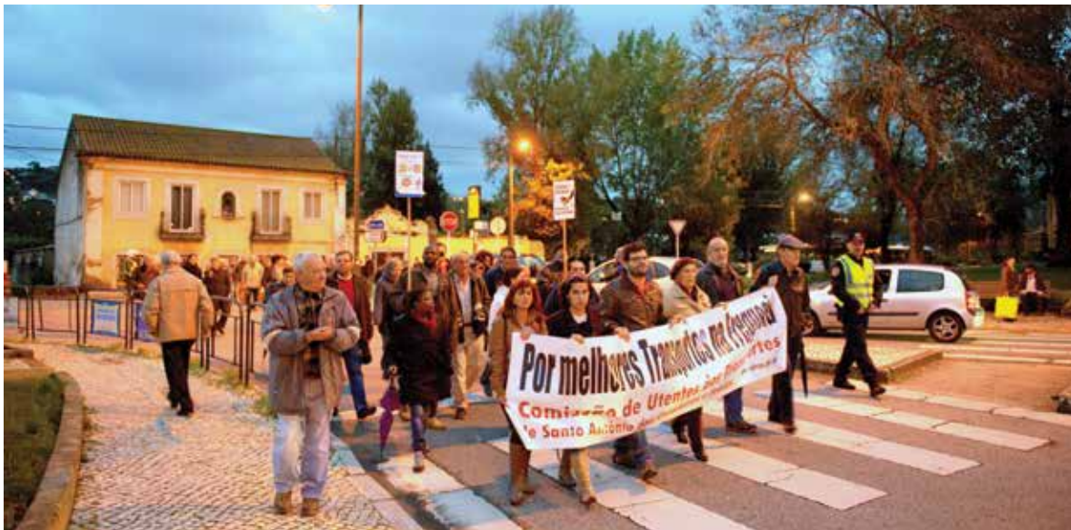
Manifestação de utentes de Santo António dos Cavaleiros

Redução dos tarifários, horários e frequência dos transportes públicos são as principais reivindicações dos munícipes do concelho de Loures nesta matéria.