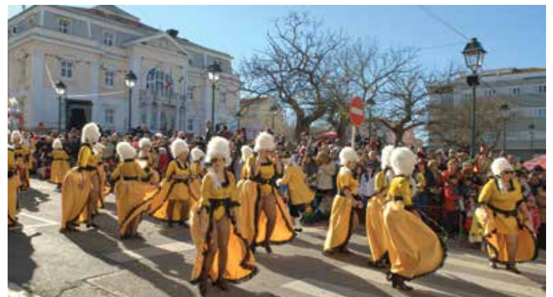
Desfile de Carnaval com 14 carros alegóricos e mil figurantes

A cidade de Loures encheu-se de cor e animação para ver desfilar os 14 carros alegóricos e os mais de mil figurantes que marcaram, mais uma vez, presença naquele que é um dos carnavais com maior tradição do país e o maior da grande Lisboa.