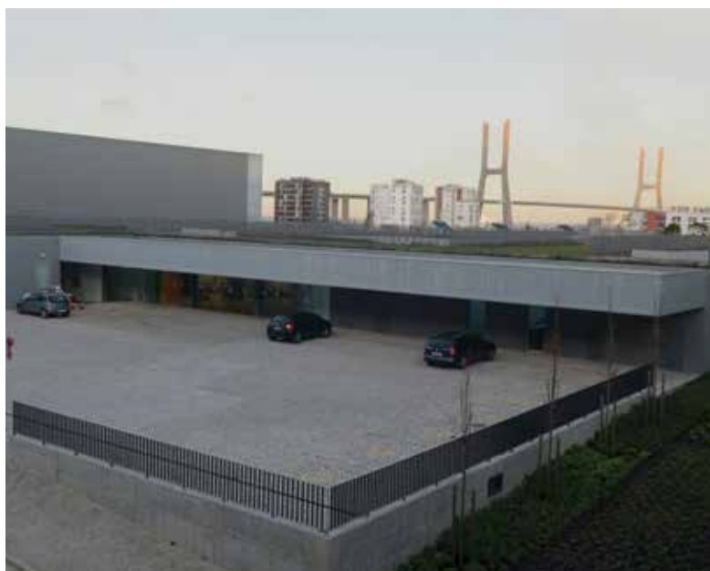
Utentes de Moscavide e Portela já têm nova unidade de saúde

Outra das preocupações do executivo municipal, neste processo, foi assegurar, junto da Rodoviária de Lisboa, o serviço de transporte público para esta Unidade de Saúde, que será garantido através do prolongamento do percurso do "Rodinhas" de Moscavide/Portela, a funcionar desde 19 de fevereiro. A extensão do percurso será implementada, a título experimental, até 31 de março, período durante o qual será avaliada a procura e as reais necessidades do serviço.