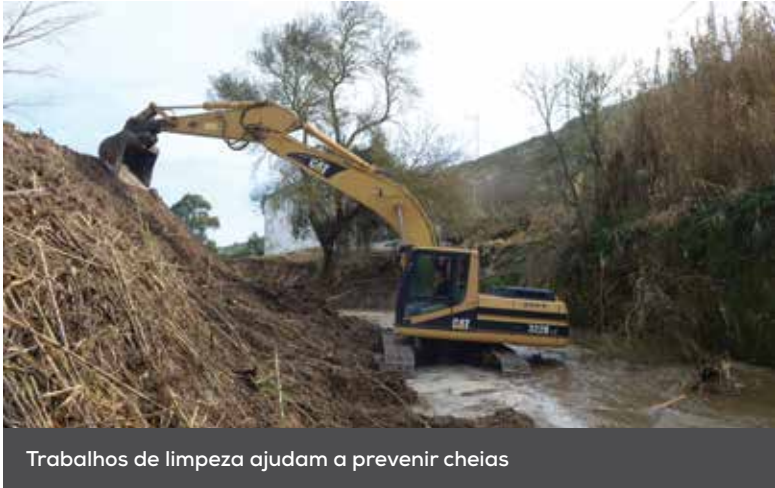
Trabalhos de limpeza ajudam a prevenir cheias

Está em curso a limpeza do rio Trancão na freguesia de Bucelas. O objetivo é desobstruir aquela linha de água, de modo a prevenir cheias.