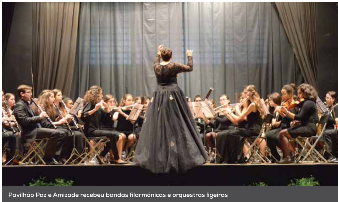
Pavilhão Paz e Amizade recebeu bandas filarmónicas e orquestras ligeiras