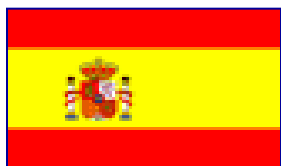
ESPAÑA - GETAFE