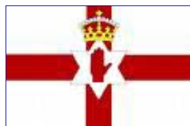
IRLANDA DO NORTE - NORTH DOWM