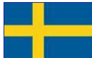
SUÉCIA – NACKA LÍDER