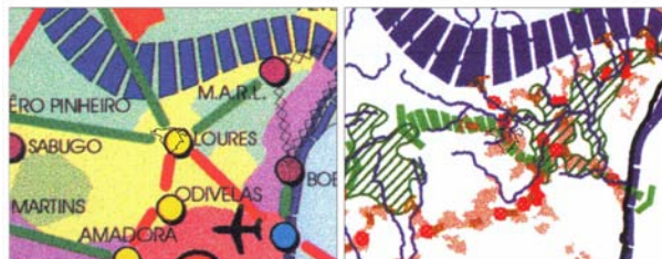
Fig. 1 - Extracto do PROT – AML: localização do PP no Esquema do Modelo Territorial e na Rede Ecológica Metropolitana

localizada no limite da área de intervenção, que será um elemento chave na qualificação desta zona.